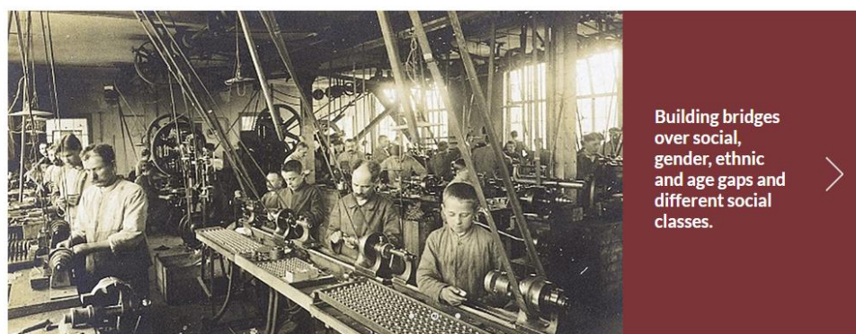
VIRTUAL REALITY ARCHIVE LEARNING (ViRAL)