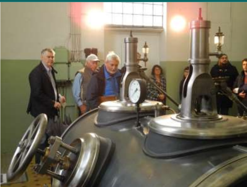
Istraživanje industrijske baštine u Dornbirnu